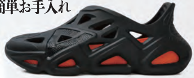
ブラック × オレンジ