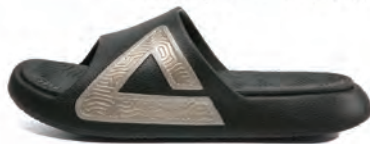
ブラック × ゴールド