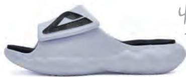
ホワイト × ブラック