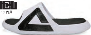
ホワイト × ブラック