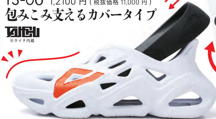
ホホワイト × オレンジ